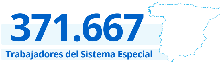
Datos totales de afiliados en alta (último día al mes). Sistema Esp. Empleados de Hogar

Esta cifra ha ido disminuyendo progresivamente desde los 414.932 trabajadores en diciembre de 2012, destacando el mes de mayo de 2015 como el de mayor afiliación con 432.910 personas en este Sistema Especial.